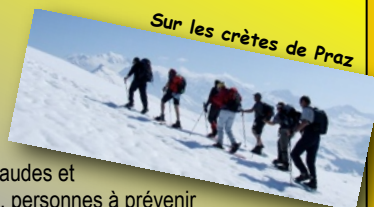
Sur les crêtes de Praz

... et choisir un niveau de randonnée adapté à sa condition physique