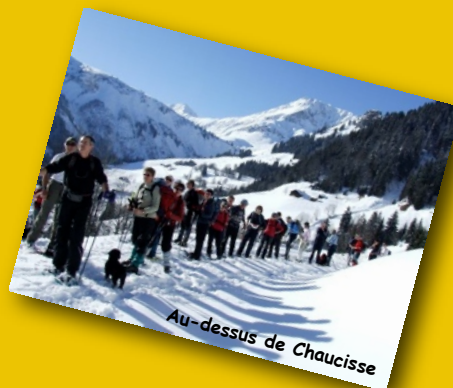
Au-dessus de Chaucisse