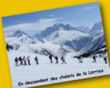
En descendant des chalets de la Lorriaz