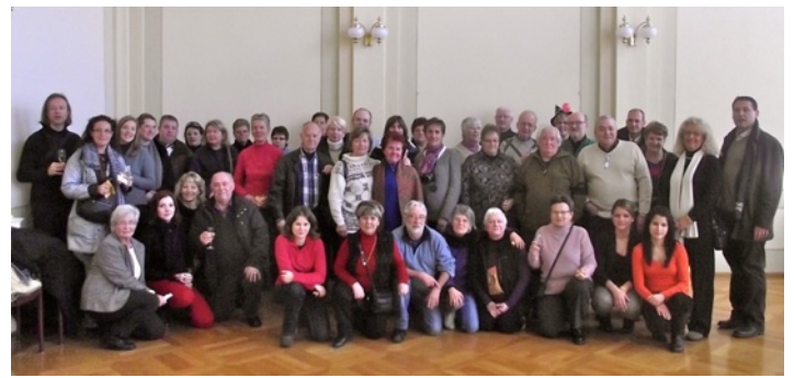
Les trois associations accueillies par le Maire de Spaichingen

Vivre à Vouilloux a accompagné les membres de la chorale Résonances et du comité de jumelage de Spaichingen pour son traditionnel Carnaval (les 18 et 19 février). Les grosses têtes grimaçantes, de très nombreux groupes bigarrés, la musique