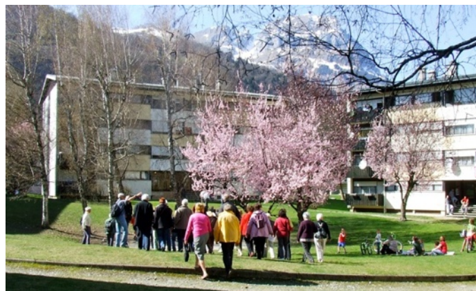
Samedi 31 mars 2012

Une cinquantaine de personnes participent à la visite du quartier, avec les explications de Carine Bonnot, architecte