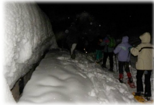
Traversée d'Ayères, à hauteur des greniers !