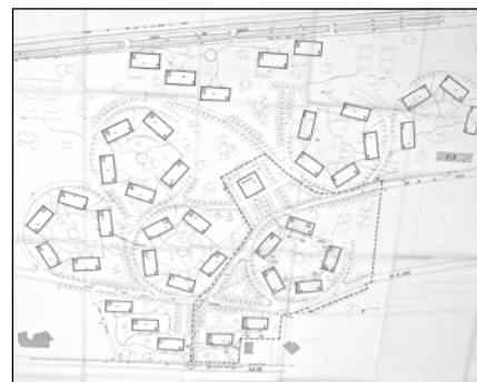
Avant-projet de plan masse du quartier

Construction en béton, bien sûr, mais en architecte savoyard, il intègre du bois, des toits à deux pentes et des loggias, tout en conservant le caractère contemporain, de larges bandes de fenêtres en façade et des pignons en béton banché.