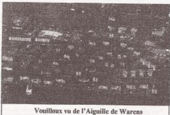
Vouilloux vu de l'Aiguille de Warens

Vouilloux... un nom un peu bizarre, une drôle de consonnance ... Quelle est l'origine de ce nom, comment ce quartier est-il né et a-t-il évolué, qui sont ses habitants, quelles sont leurs activités, leurs aspirations... La gazette voudrait essayer d'apporter quelques éléments de réponses au fil des numéros à venir.