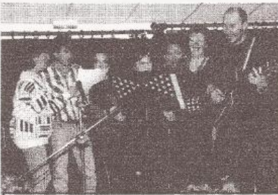
Veillée-chansons : les artistes ensemble pour le bouquet final

Le Samedi 18 Janvier, Vivre à Vouilloux avait convié une dizaine de chanteurs et musiciens amateurs de Sallanches et des environs à venir animer une veillée-chansons à la Maison de Quartier. Dans une ambiance soirée-cabaret, les 150 personnes présentes ont pu réentendre avec plaisir et émotion les airs de Brassens, Cabrel, Hugues Aufray, Fugain, Le Forestier, Goldman, Céline Dion, ...interprétés avec talent et personnalité.