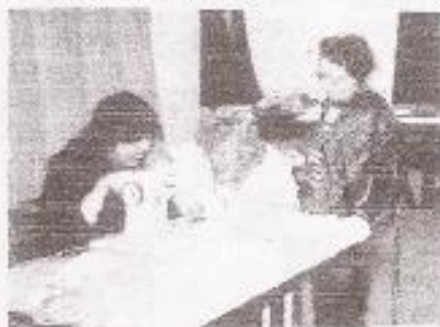
Les après-midi couture : apprentissage et bonne humeur !

Les amateurs de Tarot du Mardi soir apprécient d'avoir des partenaires féminines, ainsi que les joueurs de Pétanque. Bravo pour les pâtisseries et autres spécialités typiques (couscous, sardines etc.) dégustées toute l'année à l'occasion des manifestations et surtout le jour de la Fête de Quartier.