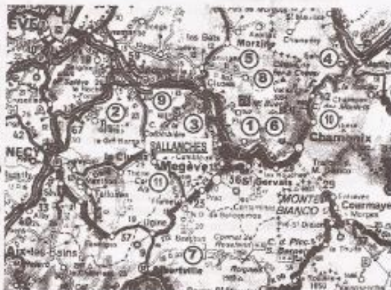
Situation des randonnées 2000

Il est toujours temps de vous joindre à notre groupe de marcheurs, n'hésitez pas à vous renseigner sur les randonnées à venir au 04.50.58.16.97