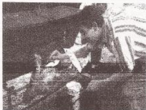
La préparation du mècheou

Un merci tout spécial à la Fromagerie Rey pour le prêt de son camion frigorifique.