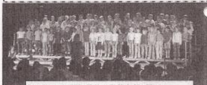
Les élèves de CE2, CM1 et CM2 de Vouilloux