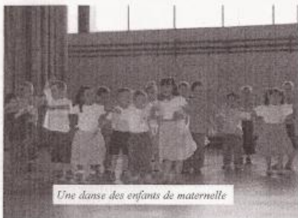
Une danse des enfants de maternelle

L'après-midi s'est poursuivi par la kermesse, organisée par les Parents d'élèves des deux écoles. Différents stands permettaient aux enfants de gagner des petits lots, tout en s'amusant, des petites filles se laissaient maquiller, tandis que des petits gourmands se pressaient devant les bons gâteaux concoctés par les mamans. C'était une belle journée permettant à tous, d'oublier les soucis qui les préoccupent depuis déjà un certain temps : la fermeture de la 10ème classe.