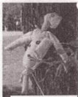
Une poupée monstre

Babar, le lézard vit dans une grotte. Il n'a pas d'enfants, pas de femme, mais il a des amis et il s'amuse bien avec eux.