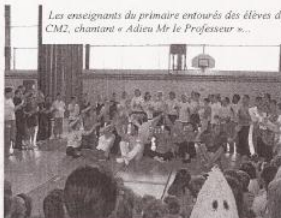
Les enseignants du primaire entourés des élèves de CM2, chantant « Adieu Mr le Professeur »...