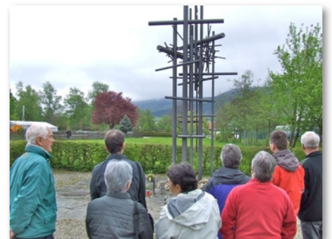
Moment de recueillement devant le monument à la mémoire des déportés