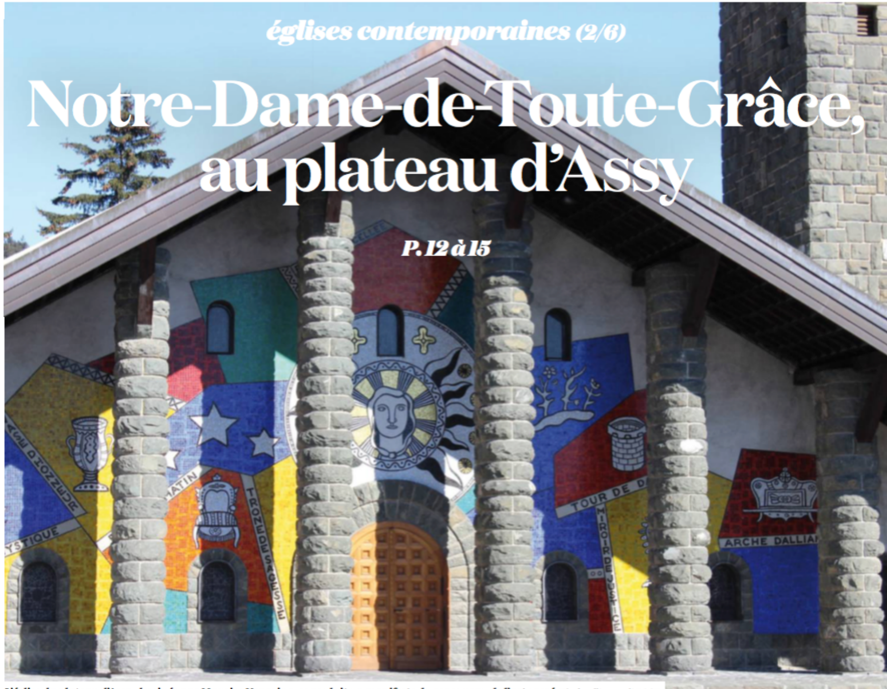
L'église du plateau d'Assy, dessinée par Maurice Novarina, se voulait un manifeste du renouveau de l'art sacré. Diocèse d'Annecy/ADAGP