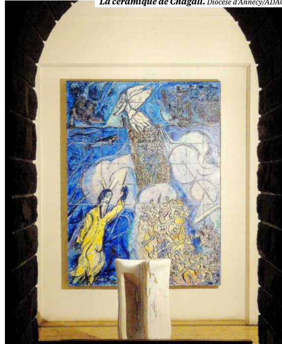
La céramique de Chagall. Diocèse d'Annecy/ADAGP