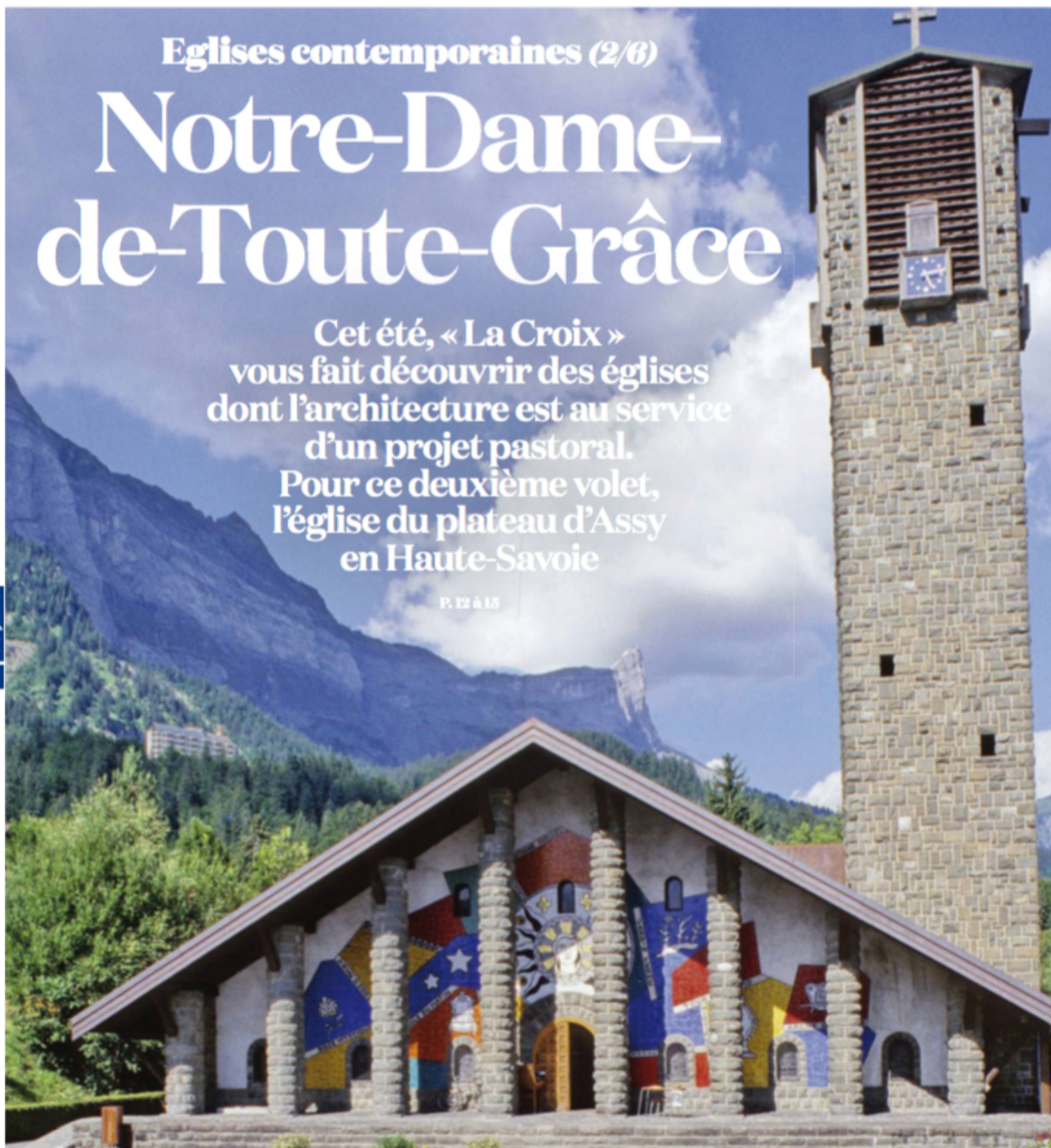
Conçue par l'architecte Maurice Novarina, l'église se niche au cœur du massif alpin. Jacqueline Salmon/Novarina Maurice/Arteria/Leemage/ADAGP