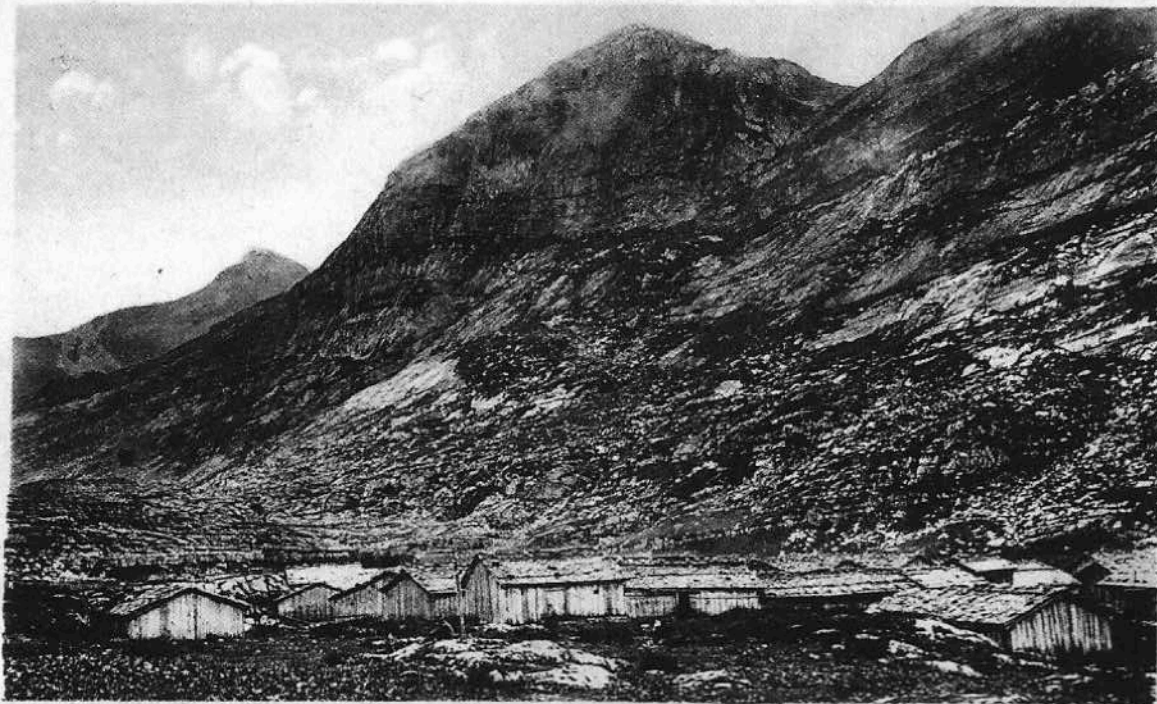
2223. - Environs de Samoëns (Haute-Savoie). - Vallée de SIXT — Les Chalets de Sales.

Le fruit d'un tel projet, l'illustration dessinée, est une proposition scénique d'un moment de l'histoire, tributaire d'un état de connaissances multiples qui, pour être honnête, sont appelées à évoluer au fur et à mesure des découvertes, sur le terrain comme en archives. Néanmoins, en archéologie, il convient aussi, à un moment donné, d'oser la restitution afin d'exposer les résultats des recherches aux critiques.